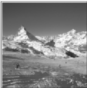
マッターホルンの雄大さは他に類を見ない。広大なゲレンデを満喫する