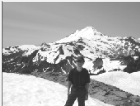
北米・ワシントン州Mt. バイカー3285mを望む